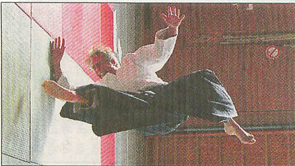
Berg - Der fliegende Professor! Im Rahmen des Aikikan-Biberkor-Forum, einer öffentli-